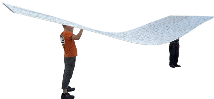
Čelo skleníku DODO 300 :

Níže naleznete ilustrativní ukázky manipulace s volně loženými deskami a příklady dodávky skleníku.